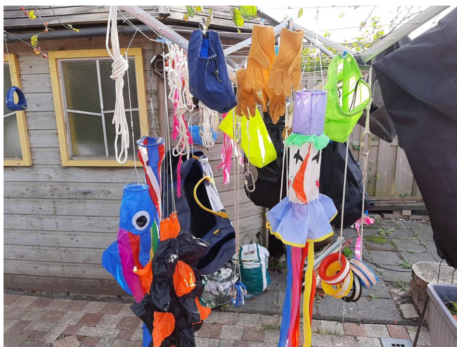
Na al die nattigheid moet er ook gedroogd worden.