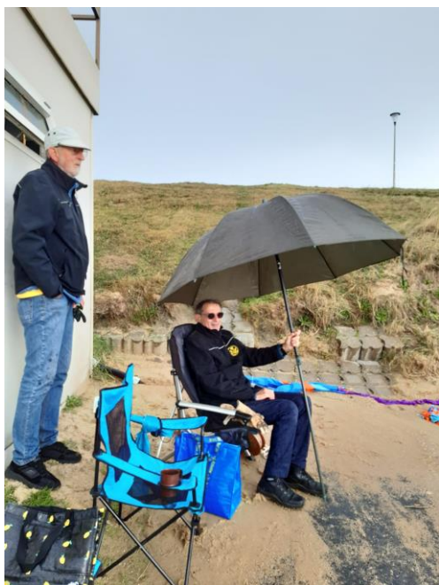
Koud en nat