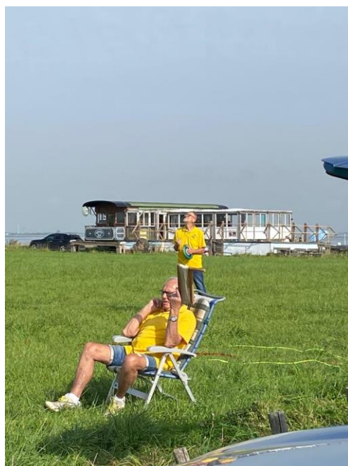
Helaas weinig wind.